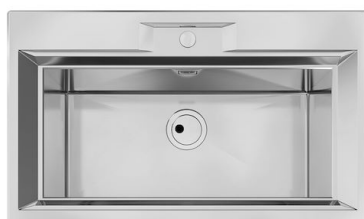
Lavello FL 2975 060